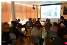
今回は4/24(火)「障害者手帳について」です

3/27(火)に実施しました。フィールド・ラベンダーの4つの機能(①就労支援・②地域活動支援センター・③相談支援・④グループホーム)を改めて知るよい機会となったのではないのでしょうか? アンダンテとラベンダー、2つの事業所を上手く使うことで、皆さんがより充実した地域生活を営んで頂けたらいいな、と思います。