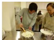
クリームチーズと生クリームを混ぜるよ。