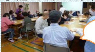
困り事や今後の課題のアンケート記入中