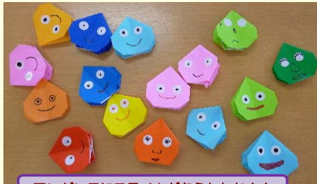
アンダンテにスライムがあらわれた!!